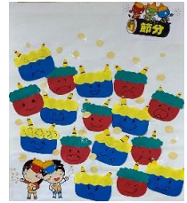
入居者様と作成しました

2022年元旦に、おみくじと福笑いを行いました。大吉を引いた方は満面の笑み、吉を引いて「もう一回引かせて」をいわれた方もいました。今年も、沢山の笑顔と笑いの絶えない1年にしたいです。新年会では、初の試みで手形で木に花を咲かせました。入居者様が最後に一筆書いて素敵な作品に仕上がりました。